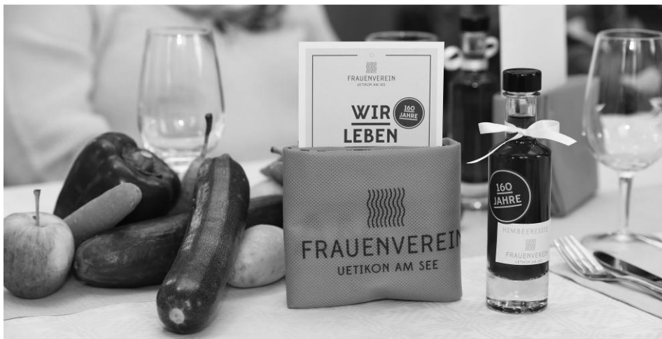
Tischdekoration an der GV 2019