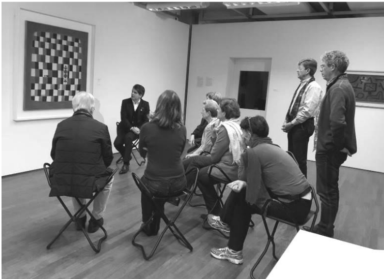
Kunstabgeleitung Paul Klee im Kunsthau Zürich

Ein grosses Dankeschön an die Leiter und Unterstützer für ihre tolle Arbeit!