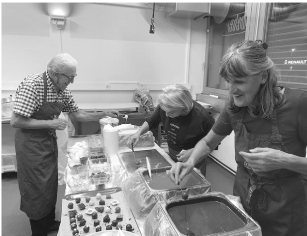
fleissige Köche am Helfer Anlass

Bei den Senioren für Senioren waren Ende 2019 217 Mitglieder registriert. Im Verlauf des Jahres 2019 kamen 15 neue Mitglieder dazu, 13 sind ausgetreten oder verstorben.