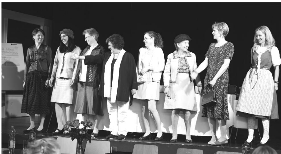
Rückblick auf 160 Jahre Frauenverein Uetikon am See vom Vorstand vorgetragen anlässlich der GV 2019