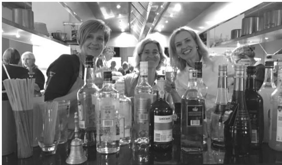
Bardamen am Helfer Anlass 2019