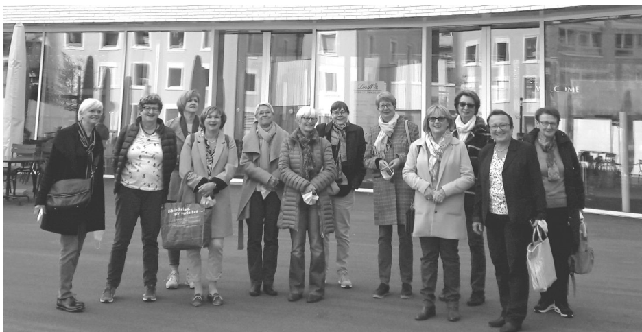
Linth Home of Chocolate - Ausflug