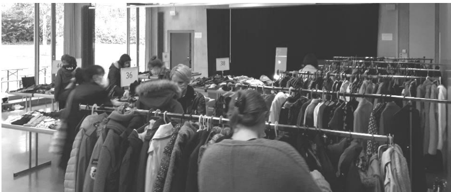
Schnäppchenjagd an der Frauenkleiderbörse