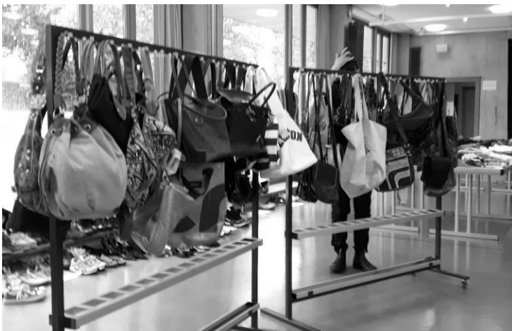
grosse Taschen-Auswahl an der Frauenkleiderbörse