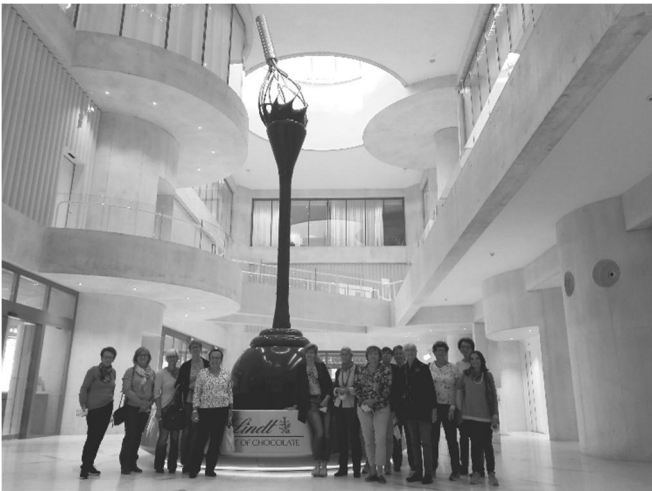
Ausflug in die „Choco-Welt“ von Linth