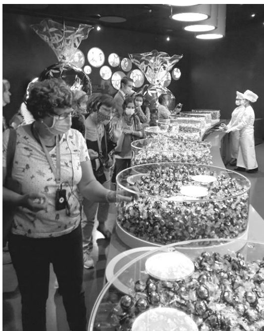
die Qual der Wahl bei Linth Home of Chocolate